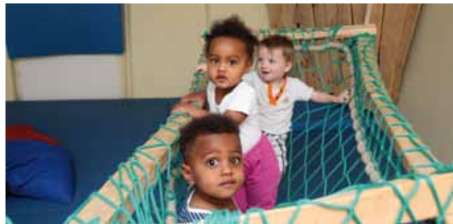
Im Weimarer Kinderhaus Sonnenhügel gibt es eine Krabbelgruppe mit integriertem Sprachangebot.