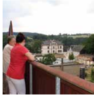
Balkon-Blick vom Haus Maria auf das Stauseeufer und den Spielplatz.