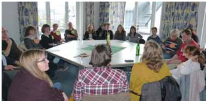
Eine wehrhafte Demokratie braucht überzeugte Demokraten - eine Erkenntnis der Demokratiekonferenz in Saalfeld. Es kamen deutlich mehr Gäste als erwartet.