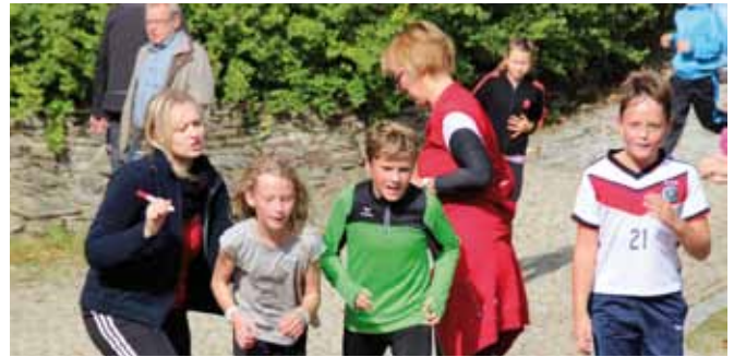
Benefizlauf für die Rollstuhlschaukel: Nach jeder Runde wurde auf der Starterkarte auf dem Rücken ein Stempel gemacht.