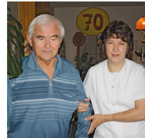
Betreuung nach einem Schlaganfall