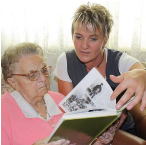
Wir nehmen uns Zeit für Geist und Seele.