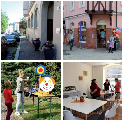
oben v. l.: Eingang zum THINKA-Büro in Pöbneck, Eingang des Diakonieladens Geben und Nehmen in Bad Lobenstein. Dort befindet sich das THINKA-Büro. unten v. l.: Sozialraumangebot in Bad Lobenstein, Café Waage

Eine weitere Aufgabe des Projektes ist die berufliche Integration. Dies geschieht durch Unterstützung bei der Stellensuche, durch Hilfe bei Bewerbungen bis hin zum Abbau von eventuell vorhandenen Vermittlungshemmnissen. Dabei sind wir eng mit anderen Angeboten vernetzt.