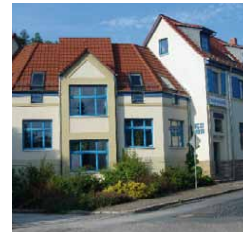
Außenstelle in Rudolstadt

Zielgruppen Wir betreuen suchtkranke und suchtgefährdete Menschen, Angehörige und Bezugspersonen verschiedener Problemlagen und Abhängigkeiten. Dazu gehört problematischer Alkoholkonsum, Konsum illegaler Drogen, pathologisches Glücksspiel oder auch Essstörungen. Es wenden sich auch Personen an uns, die Informationen zur Suchtproblematik im Allgemeinen benötigen und / oder Interesse an Suchtprävention haben, zum Beispiel Ärzte, Beratungslehrer, Mitarbeiter sozialer Dienste und Einrichtungen oder auch Betriebe.