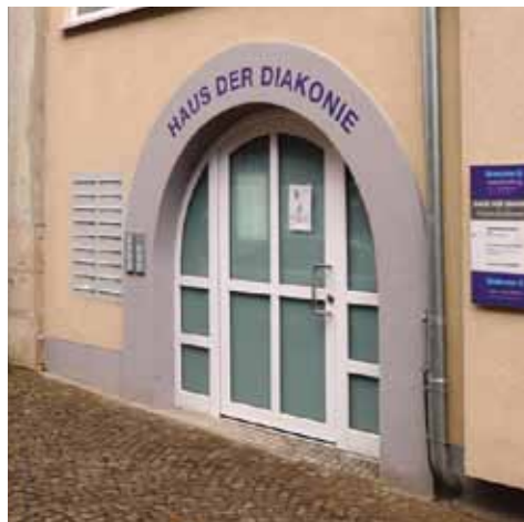
Haus der Diakonie in Saalfeld

Die Infrastruktur und Umgebung der Stadt bietet Möglichkeiten der kulturellen, sportlichen und vor allem lebenspraktischen Betätigung wie z. B. Schwimmhalle, Kino, Freibad, Museen und Galerien, erschlossene Wanderwege, Krankenhaus, Arztpraxen und ein Angebot verschiedenster sozialer Dienste und Einrichtungen. Diese Angebote können auch im Zusammenhang mit unserer Gruppenarbeit genutzt werden.