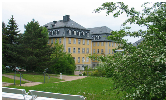
Das MAV-Büro Ebersdorf befindet sich im Seniorenzentrum Emmaus.

Sie können sich jederzeit an uns wenden, wenn Sie Fragen zu Arbeitszeit, Dienstplan, Urlaub oder anderen Themen haben.