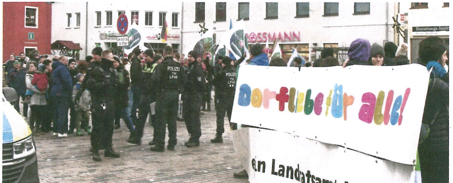
Die erste „Dorfliebe für alle“-Kundgebung auf dem Schleizer Neumarkt mit Redebeiträgen und Musik. Ein massives Polizeiaufgebot schützte die mehr als 200 Teilnehmer der Demonstration.

Etliche Menschen, die außerhalb unseres schönen Saale-Orla-Kreises leben, dürften ihre Aufmerksamkeit auf die Landratswahl in einer Woche richten. Das Superwahljahr 2024 beginnt bei uns. Man darf gespannt sein. Doch zunächst, liebe Leser, haben wir heute unsere Reporter Augen auf die protestierenden Bauern. Den Landwirten und vielen anderen geht so einiges auf den Keks. Ob es was bringt, werden wir schon bald erfahren. Vielleicht an der Wahlurne und mit Sicherheit in Ihrer Heimatzeitung.